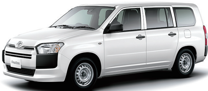
トヨタ プロボックス