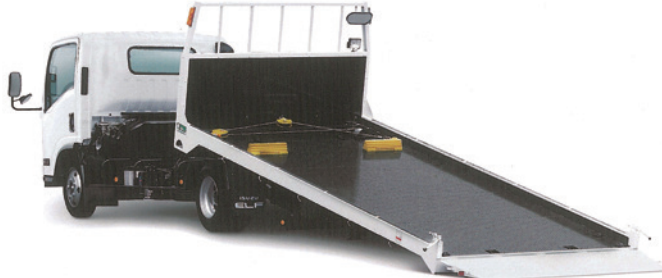
セフテローダー [一般仕様]