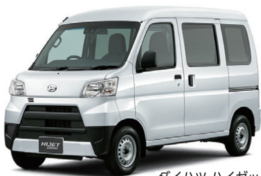
ダイハツ ハイゼット