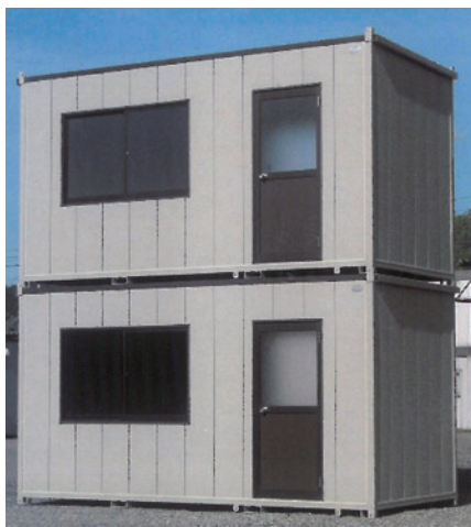
在庫保管時2段積み