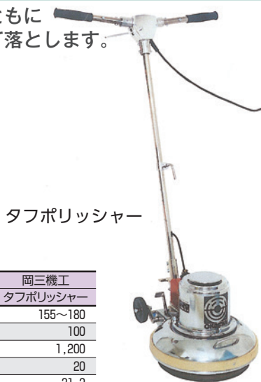
タフポリッシャー