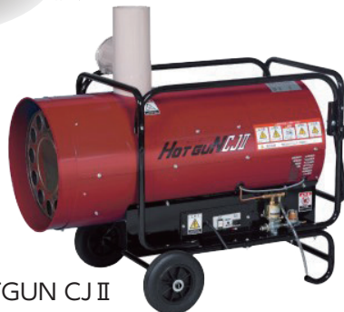
HOTGUN CJ II