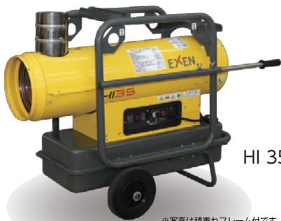
HI 35 100V