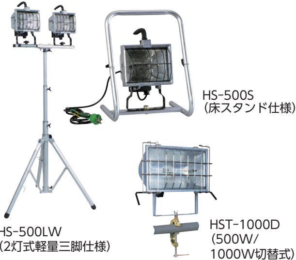
HS-500LW (2灯式軽量三脚仕様)