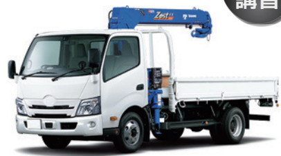
2トン クレーン付トラック