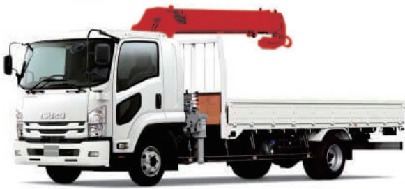
4トン クレーン付トラック