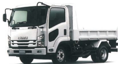
4トン ダンプ (三方開)