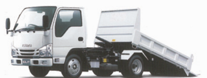
2トン ローダーダンプ