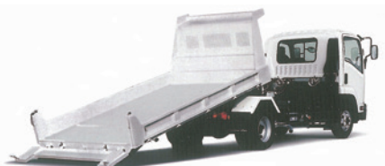
4トン ローダーダンプ