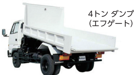
4トン ダンプ (エフゲート)